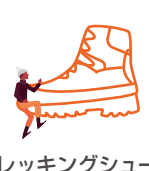
トレッキングシューズ・ 登山シューズ